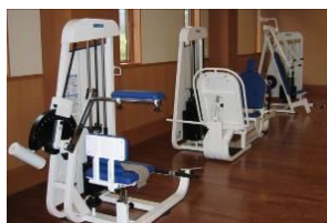
機能訓練器具(パワーリハビリ)