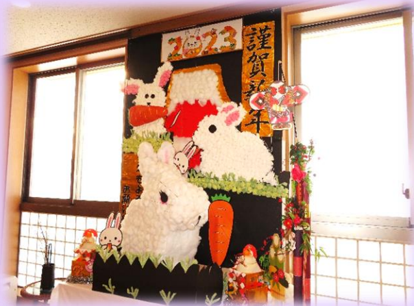
干支のうさぎ3羽と赤富士です。