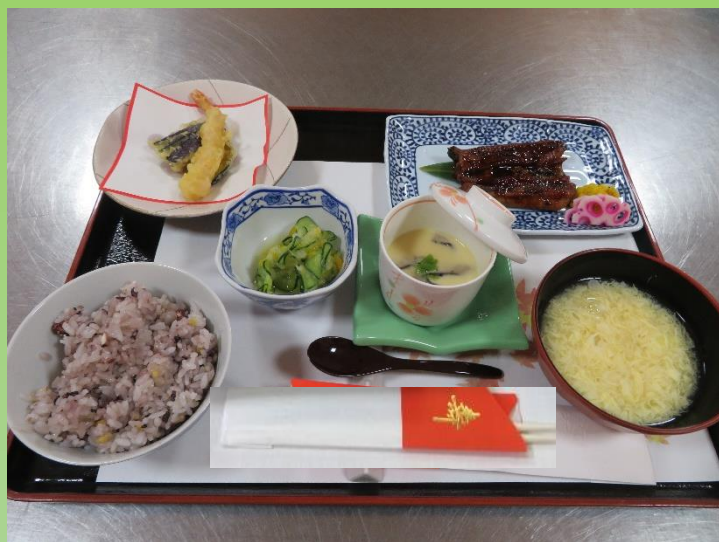
呑み込みが難しい方には柔らかいお食事を用意しました。