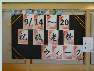
デイサービス フレンデイ大曲