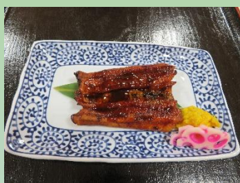
うなぎの蒲焼きと 菊のおひたし

白麦・黒米・挽割とうもろこし・もちあわ・もちきび もち米・発芽赤米・発芽玄米・焙煎挽割大豆・黒煎りごま 白煎りごま・たかきび・アマランサス・キヌア 挽割はと麦