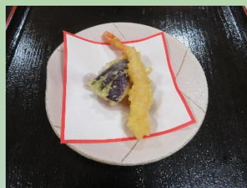
天ぷら盛り合わせ えび なす かぼちゃ