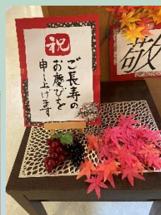
こもれびの杜 各ユニットより