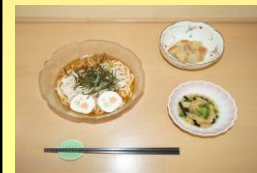
毎週水曜は麺の日