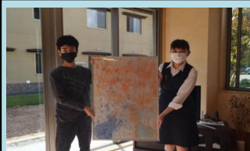
愛仙様より、新しい作品をお預かりしております！

日頃より当施設の運営につきまして、多大なるご理解とご協力を賜り厚く御礼申し上げます。さて、再度感染拡大が見られておりました新型コロナウイルスですが、当苑でも9月19日以降に、ご利用者様や職員で数名の感染が確認されました。その後、個室対応に切り替える等の対策を取り、9月末には新たな感染者などなく、対応を終了しております。ご利用者様、ご家族様、各関係機関には、大変ご心配をおかけしました。令和5年9月20日(水)に予定しておりました「敬老感謝祭」については、日程を延期し10月27日(金)に行くこととしております。現在、新型コロナウイルスをはじめ、例年より早い段階でインフルエンザの流行も聞かれております。面会等も10月より以前と同じ予約制(平日)で再開しておりますが、地域や施設内での状況により変更されることも予測されます。入居者様に関しては、新型コロナワクチン接種は10月、インフルエンザワクチン接種は11月を予定しております。今後も、感染予防策の徹底を継続してまいりますので、ご理解とご協力の程お願いいたします。