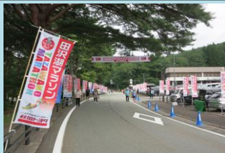
9/17(日) 田沢湖マラソンの様子