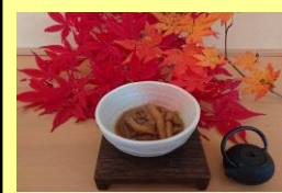
ご家族より頂いた食材で作ったアケビの味噌和え！