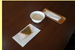
ひな祭りの甘酒と桜餅