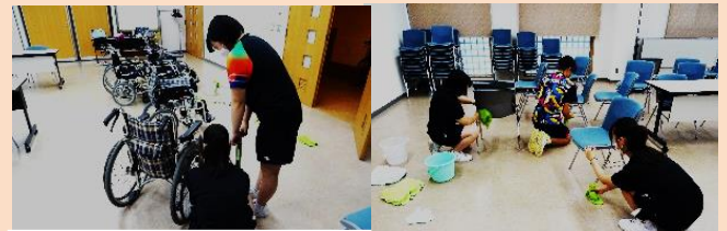
車椅子のふき掃除 机と椅子の清掃