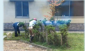
冬支度始めました！