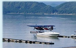
水上飛行機が田沢湖へ！