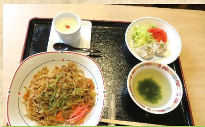
焼きそば・わかめスープ