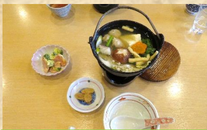
塩ちゃんこ鍋（一人鍋）